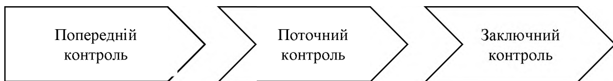
Рис. 2. Види контролю на підприємстві

Встановлення чи досягло підприємство поставленої мети здійснюється шляхом забезпечення виконання контрольної функції бухгалтерського обліку. Контроль відрізняється як за часом його здійснення, так за кінцевою метою його проведення (рис.2).