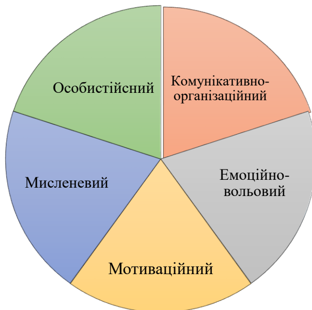
Рис. 2. Психологічна структура лідерських якостей.

✓ Особистісний (активність, ініціативність, цілеспрямованість, надійність, відповідальність, почуття гумору, оптимізм, чесність, патріотизм, прагнення до саморозвитку).