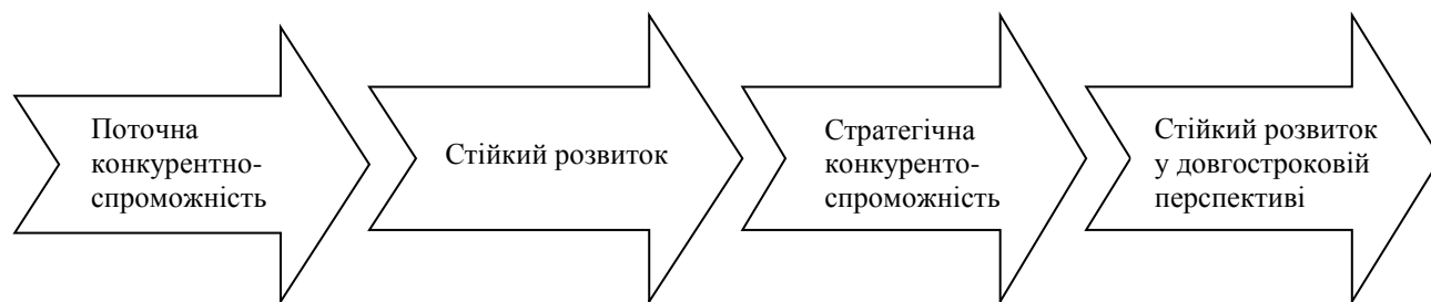
Рис. 1. Взаємозв'язок і взаємообумовленість конкурентоспроможності підприємства і стійкого розвитку

Як зазначалося, між стійким розвитком та конкурентоспроможністю підприємства існує взаємозв'язок та взаємообумовленість, що виражається, зокрема, у тому, що стійкий розвиток підприємства забезпечуватиме підвищення його конкурентоспроможності, а стратегічна конкурентоспроможність підприємства сприятиме забезпеченню реалізації цілей його стійкого розвитку в довгостроковій перспективі (рис. 1).