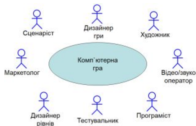
Рис. 1. Проектні ролі процесу розробки комп'ютерної гри

Говорячи про проектне навчання, в якій учень повинен уміло використати різні інструменти для досягнення мети створення прототипу продукту, який має бути корисним, необхідно розглядати учня у його суб'єкт-суб'єктних взаємозв'язках із комп'ютерною грою вже не як пасивного споживача, а як її власного творця, формуючі важливі навички проектних ролей, представлених на рис. 1.